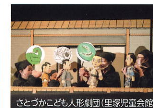
第51回こども部門最優秀賞受賞作品「まんじゅう?!」