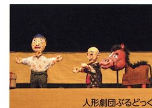
第51回大人の部門最優秀賞受賞作品「しどうほうかく」

【日程】11月18日(土)・19日(日)・23日(木・祝) 【部門】①大人の部門(一般の部、初心者の部) ②こども部門(小学生の部、中高生の部) 【出品料】①大人の部門 1作品2,000円 ②こども部門 無料 【参加費】①大人の部門 一人500円 ②こども部門 一人200円 【会場】札幌市こどもの劇場やまびこ座