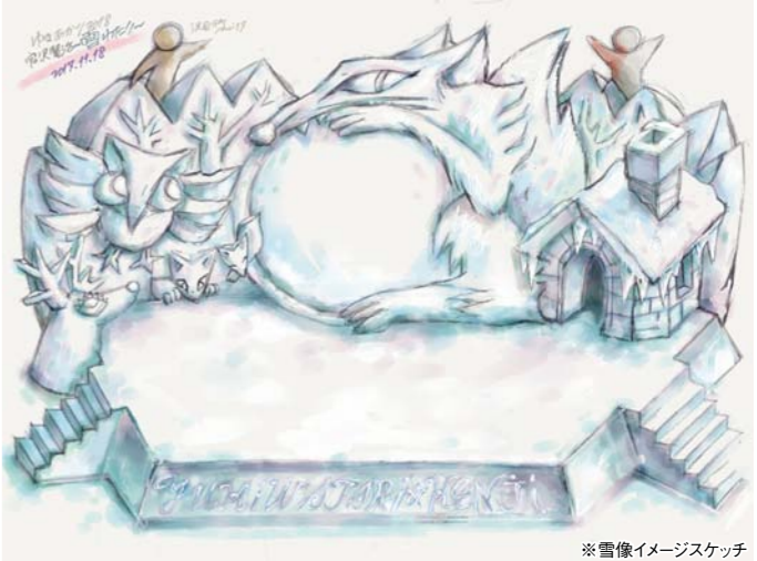
※雪像イメージスケッチ

【日時】2月9日(金)・10日(土)・11日(日・祝) ①18:00 ②19:00 1日2ステージ(上演時間約15分) 【場所】こぐま座前広場 【入場】無料