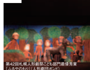
第42回札幌人形劇祭こども部門最優秀賞「ふるやのもり」(人形劇団ポンド)