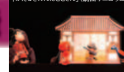
第42回札幌人形劇祭大人部門優秀賞(初心者)「かえるものんだとさん」(劇団オニゴッコ)

【日時】11月22日(土)・23日(日)・24(月・祝) 午前11時~午後3時 【料金】3歳以上 1日券500円 2日券700円 3日券900円